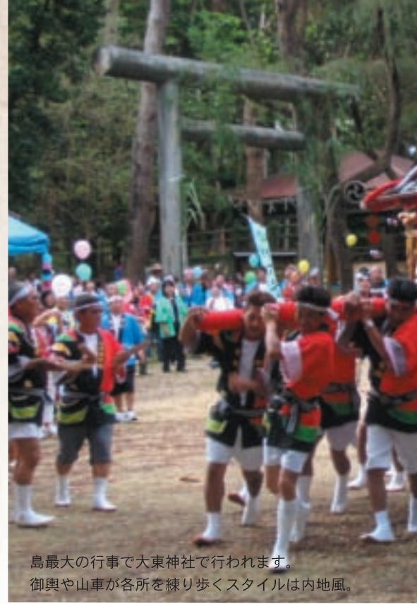
島最大の行事で大東神社で行われます。御輿や山車が各所を練り歩くスタイルは内地風。