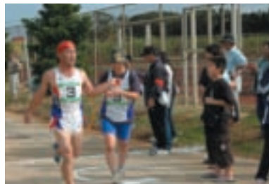
陸上競技大会・駅伝大会