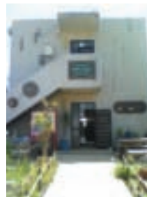
プチホテルサザンクロス